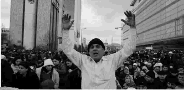
in Ankara, kurz bevor die